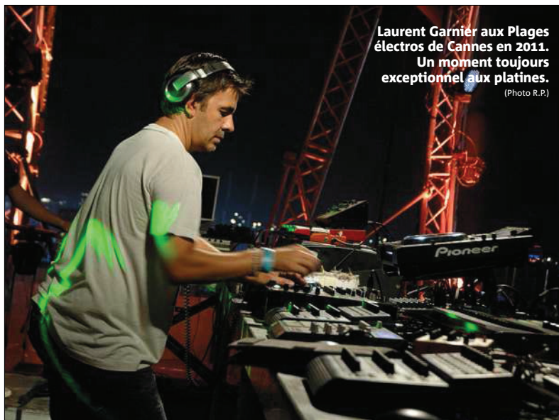
Laurent Garnier aux Plages électros de Cannes en 2011. Un moment toujours exceptionnel aux platines.

We are together. Samedi 31 octobre, de 20 heures à 8 heures. Dock des Suds, à Marseille. Tarifs : de 21,80 € à 36,90 €. www.wearweart.fr